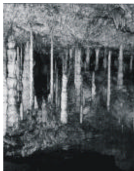
Grotte de Han

Grotte de Han are si o deosebita importanta preistorica, arheologica si, paleontologica. Sapaturile pe râul Lesse au dat la iveala înhumari colective subacvatice datând din epoca Bronzului, ceea ce reprezinta un caz unic în lume pâna în prezent, înca neexplicat de specialisti.