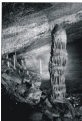
Grotte de Han

Prima amenajare turistica s-a facut în 1850, dar ea era vizitata destul de mult si anterior amenajarii. Pestera a fost deschisa publicului în 1912 si reamenajata la nivel european în 1924. Vizita începe în nivelul superior si dupa parcurgerea traseului cu Catedrala, unde au fost gasite si urme ale omului